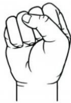
"Je suis moyennement satisfait"